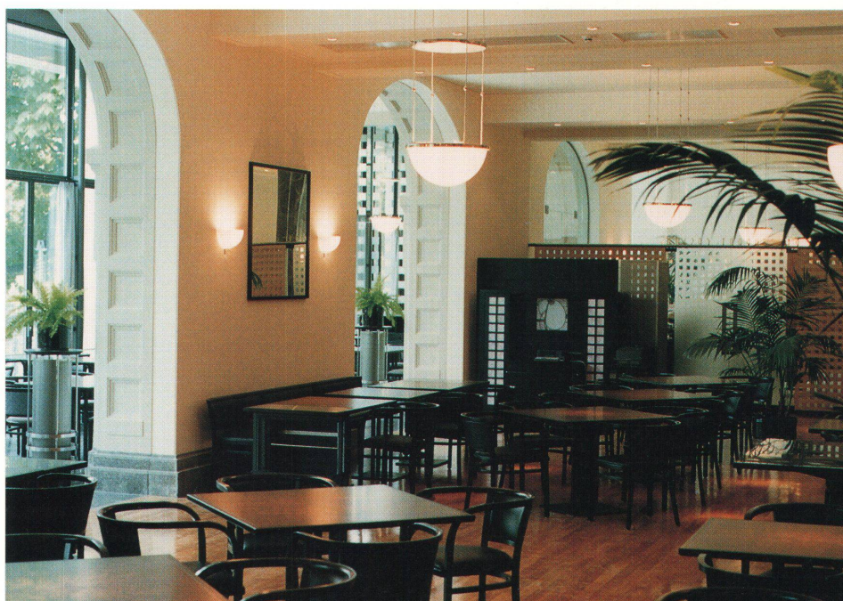
Das grosse Restaurant. Im Hintergrund die halbhohen Holzwände als Raumteiler