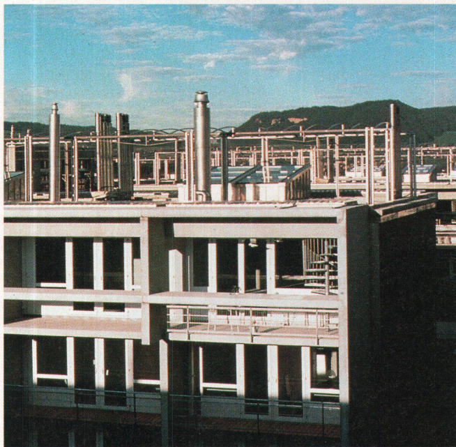
Die Siedlung Baumgarten in Bern

«Hochparterre» Nr. 6-7 erscheint am 11. Juni 1997