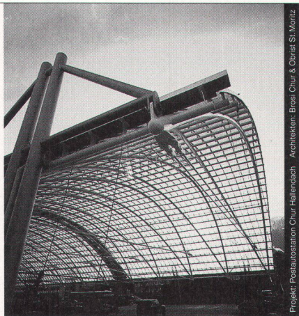
Projekt: Poststation Chur, Hallertuch - Architekten: Brossi, Chur & Obereg, St. Moritz

Stahl-Glas-Konstruktionen in architektonisch perfekter Voll- endung verwirklichen wir mit innovativen Ideen und höchsten Anforderungen an Materialien und Ausführung.