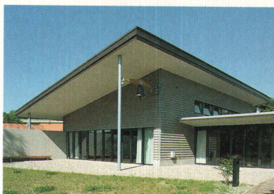
Der Kirchentrakt des Evangelisch-Reformierten Gemeindezentrums Sursee von aussen