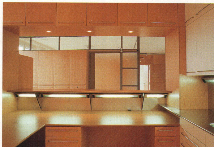
Blick vom Empfang in den Wartezimmer, hinten die Türe zum Sprechzimmer

Die leuchtende Schachtel des Warteraums ist eher ein Möbel als ein Einbau