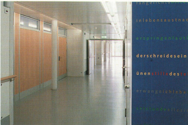
Farbflächen mit poetischen Zitaten flankieren den Bettenlift

Die Patienten bleiben durchschnittlich drei bis vier Wochen zur Abklärung in der Epilepsie-Klinik. Sie sind nicht ans Bett gebunden, bewegen sich viel und haben genügend Zeit, die Textbilder mit auf den nächsten Spaziergang zu nehmen. Der fehlende Raum zwischen den Wörtern sorgt dafür, dass die Patienten immer wieder andere Teile des Textes lesen, und die Groteskschrift «Syntax» unterstützt den fließenden Charakter des Typobildes, sie hat den Schwung des Meisselns aus ihrem römischen Ursprung in die Neuzeit mitgenommen. Christoph Settele