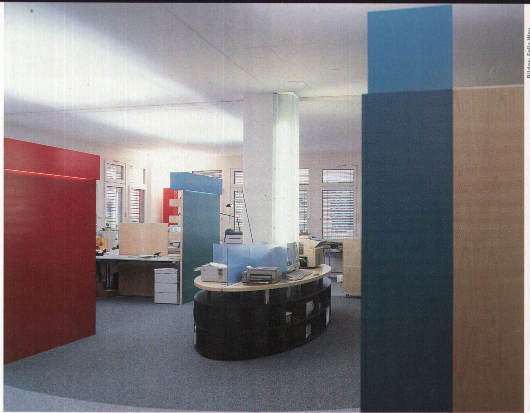
Blick in die Verkehrszone mit Druckzentrale und «Leuchtmast». Links davon die Raumelemente mit den «Balkonkisten»