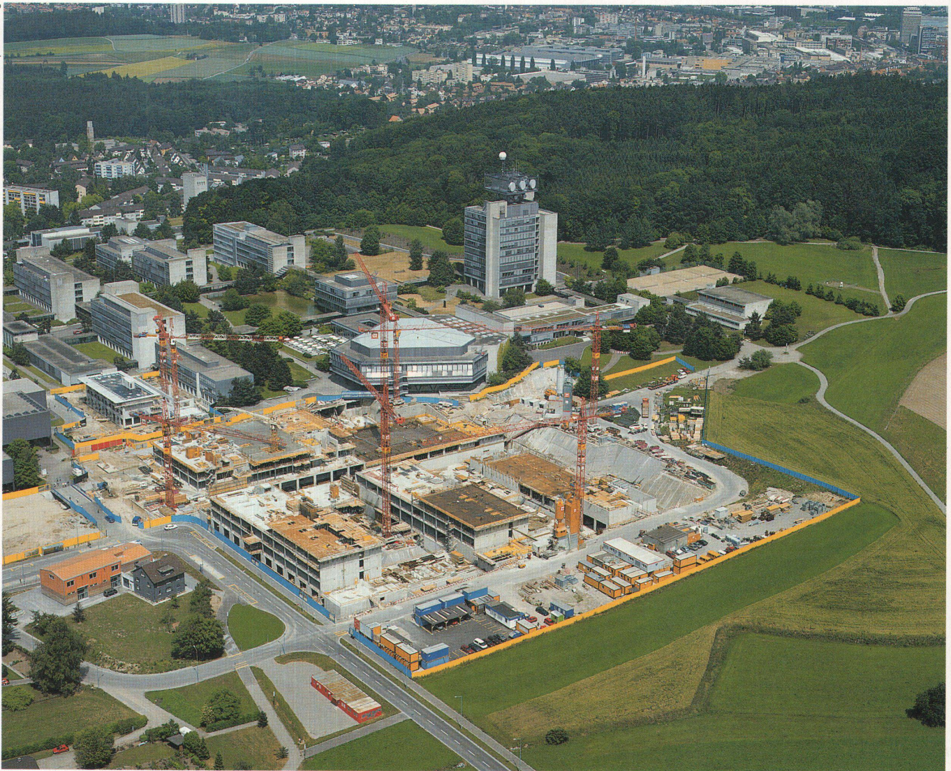
Zu Besuch auf einer der grössten Baustellen: Erweiterung der ETH Hönggerberg. 2800 Lastwagenladungen Aushub für Nutzfläche in der Grössenordnung von 12 Fussballplätzen