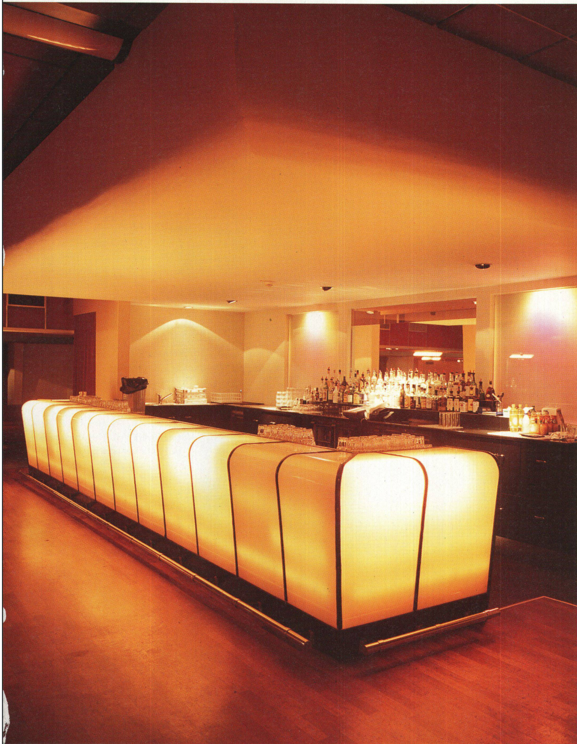
Rubys lange Sunset Bar ist eine grosse, dimmbare Leuchte, eine wabbernde Lichtbarriere als Gegengewicht zur Tanzfläche