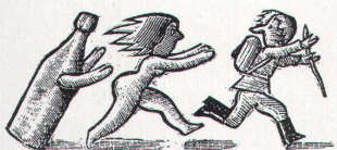
Egbert Herfurth, 1990