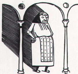
Gerhard Marcks, 1955