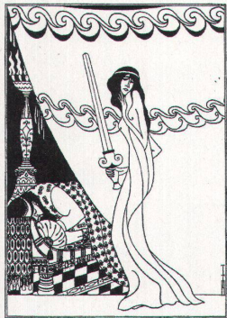
Thomas Theodor Heine, 1908

Die Illustration in deutschen Büchern ist eines der Themen der «Vollkommenen Lesemaschine».