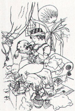
George Grosz, 1955