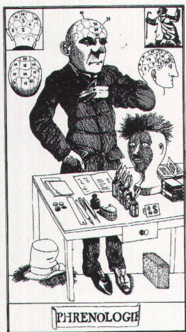
Klaus Ensikat, 1984