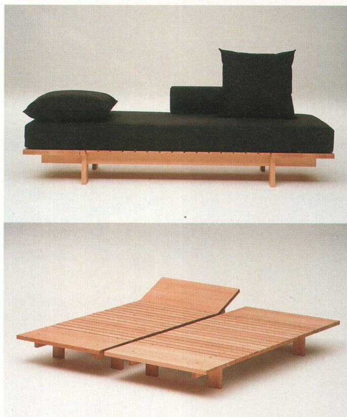
Kurt Greter's Ruhebett «Kao» lässt sich mit Rollen und Kissen im Nu zum Day Bed oder zum Sofa umwandeln. Der Unterbau aus Massivholz ist in vier Teile zerlegbar. Kopf- und Fussenteil werden von 2 T-förmigen Längsverbindungen getragen und bilden ein festes Stück. 3 Lättli-Elemente werden darauf gelegt.

Die journalistische Erfahrung ist natürlich nicht weiter überraschend: Es ist durchaus erhebend, für einmal im Fieber der rasenden Reporter zu leben, die eifrig wie die Biber Informationen zusammenscharren. Wichtig: Online-Publizieren erträgt nur knappe Texte, je prägnanter um so besser. Schon hatten wir erste Beiträge geschrieben und Disketten mit Bildern gefüllt, nun sollten die Informationen aufs Netz. Doch da kam die Ernüchterung: Die Technik tat nicht wie wir wollten. Von den zwei Computern konnte jeweils nur einer Daten aufs Netz laden. Dazu kam ein langsamer Internetanschluss mit Wartezeiten bis zu einer Viertelstunde und kontinuierliche Netzzusammenbrüche.