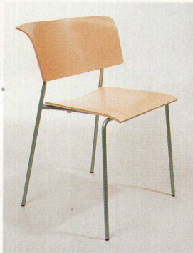
«Qvintus» mit breiter Rückenlehne

überbewertet, durchbrochen und setzte auf eine internationale Linie. Und wurde prompt kritisiert, als er 1987 mit dänischen Designern zusammenarbeitete. Die neue Stuhlgeneration mit «Campus», «Virtus», «Qvintus» und «Corpus», die inzwischen mehr als 60 Prozent des Umsatzes ausmacht, haben Peter Hjort-Lorenzen und Johannes Foersom entwickelt; beides Möbeldesigner aus Kopenhagen, der Einfachheit verpflichtet und vom Schiffbau und der Möbelschreinerei geprägt. Möbel sollen sich leise in die Architektur einfügen und lange leben. Auch formal ist die Besinnung auf solche Qualitäten der frühen Moderne ablesbar.