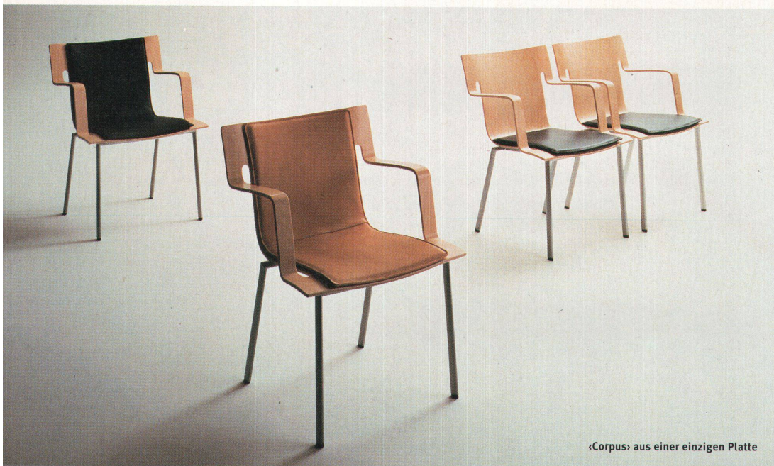
«Corpus» aus einer einzigen Platte