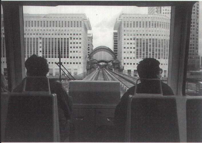
Architekturbild 1997: Dockland Light Railway, Canary Wharf Station 1991, Architekt: Cesar Pelli; Fotograf: Clive Frost, London 1995

Hochparterre 5 erscheint am 6. Mai 1998.