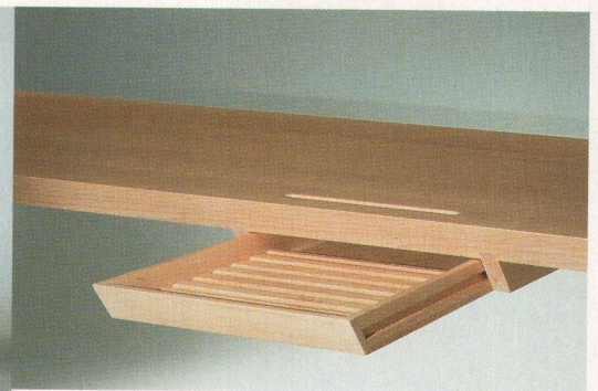
Der Tisch «Damenschreibtisch», entworfen von Helmut Galler: Stabiles Blatt dank der Schubladenführung