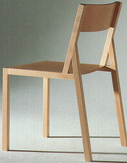
Stuhl «Delta», entworfen von Christian Steiner: Buche massiv, Sitz und Rücken aus Sperrholz