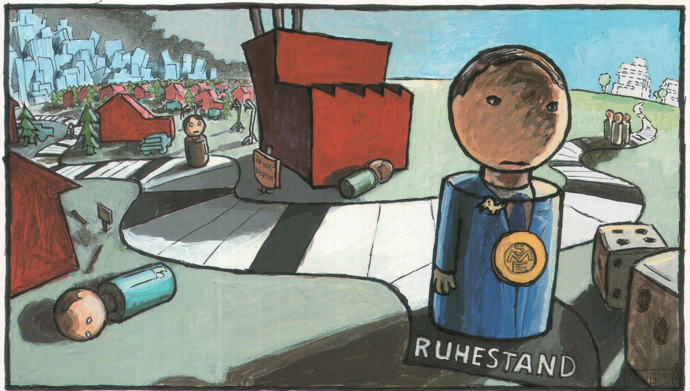
Illustration: Gregor Gilg