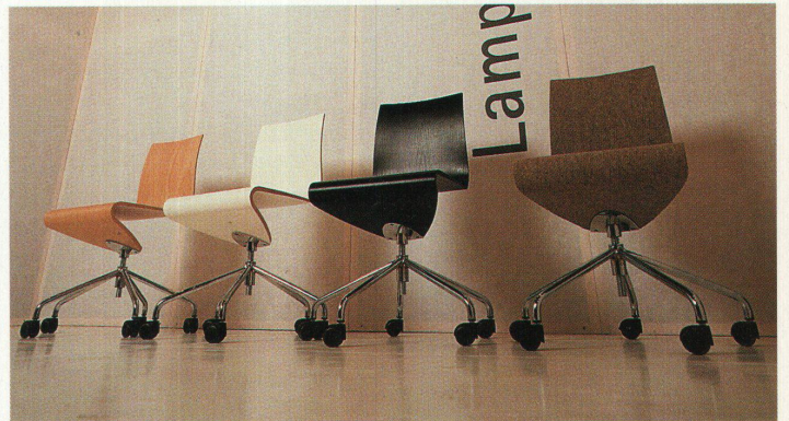
Der Bürodrehstuhl mit federnder Sitzschale von Peter Horn