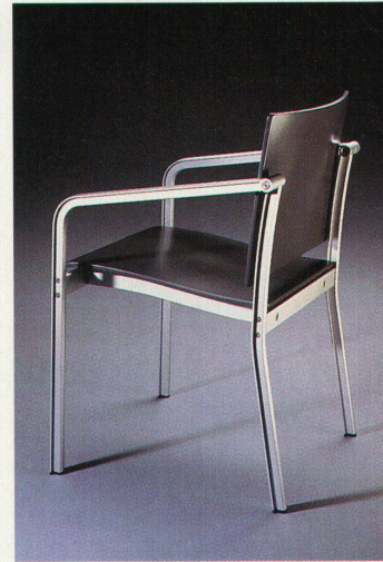
Norman Fosters Stuhl für Thonet: Aluminiumprofile bilden den Rahmen, Rückenlehne und Sitzfläche erzwingen eine preussische Sitzhaltung