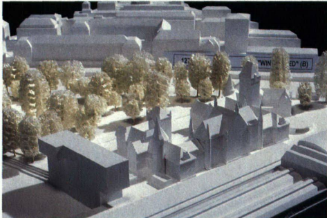
2 Die Sihllösung. Lussi & Halter stellen einen markanten Block an die Sihl