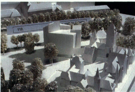
3 Die Limmatlösung. Oliver de Perrots gezackter Turm kommt dem Bilbao-Effekt nahe