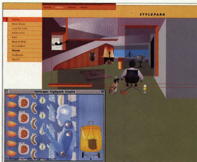
Neben der Rubrik «Inform» mit Dokumentationen zu Produkten gibt es auf stylepark.com auch die Sparte «Inspire», wo Visionen zu Themen wie z.B. «Plastic» verspielt umgesetzt werden

ten, werden nicht erst während ihres Besuchs im «Stylepark» ihre Vorstellungen durchmöblieren. Ein guter Teil ihres Könnens besteht ja gerade darin, dass sie von vornherein wissen, welches Möbel sie wo platzieren möchten. Die Kenntnis über das vorhandene Angebot ist ja ihr Kapital. So wird auch diese Klientel dieses Portal eher als Ergänzung empfinden – und dementsprechend nur sporadisch nutzen. Es wird also darum gehen, dieses Angebot möglichst breit zu streuen – und es eben nicht nur auf die peripher auftretenden Bedürfnisse einer einzigen Berufsgruppe auszurichten. Denn, um nochmals auf die Ledersessel zurückzukommen, die Begehrlichkeiten werden beim Kunden, bei jedem von uns geweckt. Und das nicht nur während der Bauzeit. Und gewiss muss auch der Service komfortabler gestaltet werden, nur schauen geht nicht, ich will mit möglichst wenig Aufwand kaufen. Denn wir wissen ja, je versteckter ein Kleinod ist, umso grösser ist der Aufwand es zu beschaffen.