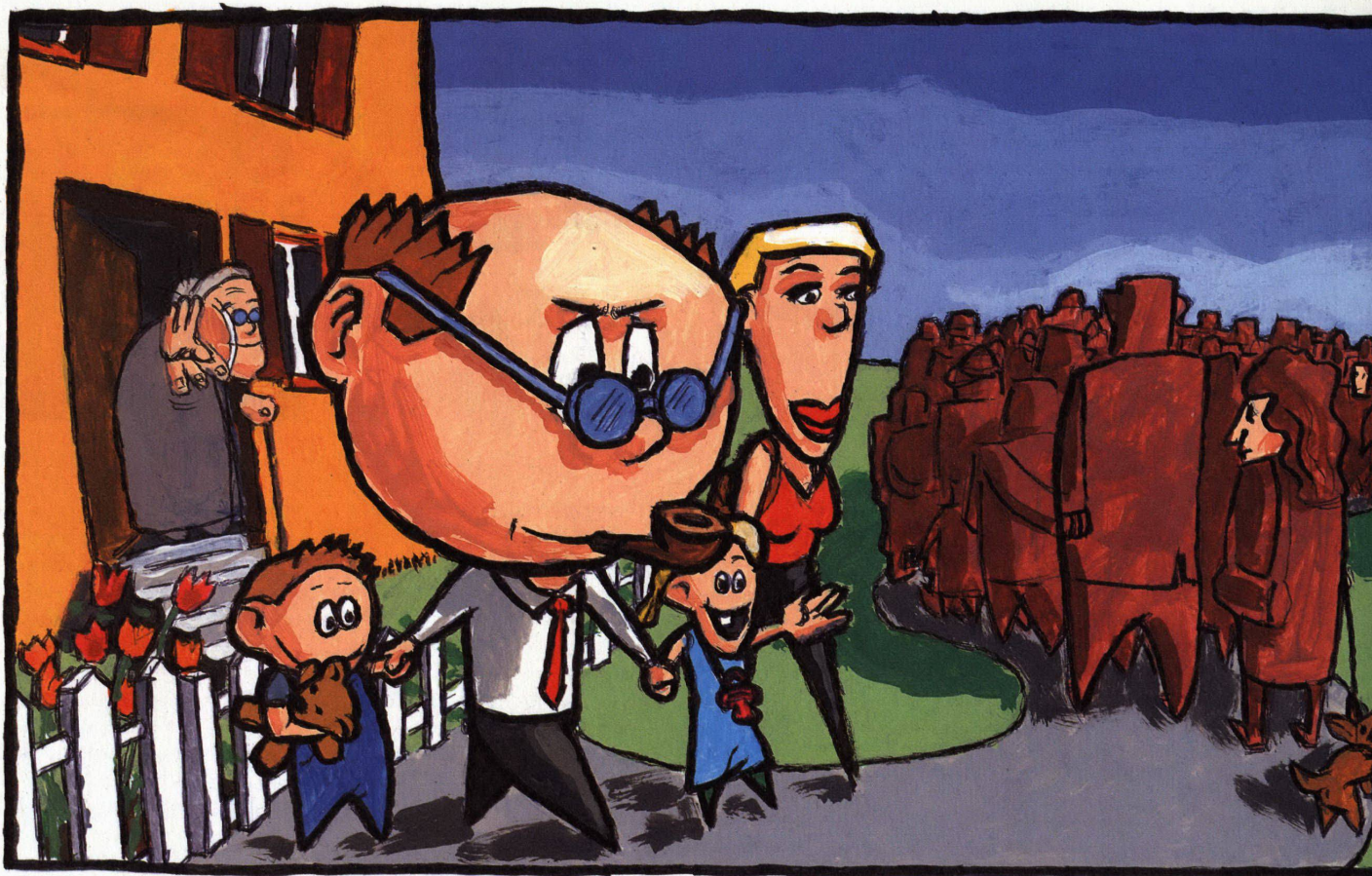
Illustrationen: Gregor Gilg