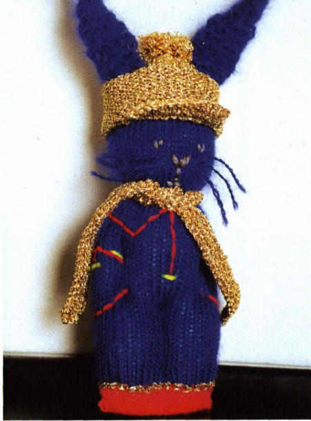
Alle Jahre wieder Hasen in Gold, Silber und Bronze für «Die Besten»

Hochparterre 12/2001 erscheint am 19. Dezember 2001.