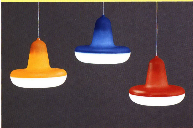
NAME: MELO HERSTELLER: RIBAG, MUHEN VERTRIEB: AUSGEWÄHLTE FACHGESCHÄFTE DESIGN: MARCO CARENINI LAMPEN: 1 x 18 WATT, KOMPAKT PREIS: CHF 218.–