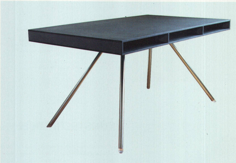
Die vier Beine vom Tisch «Atelier» stecken in Hülsen, diese wiederum in Klötzen in der Kastenkonstruktion aus MDF. Für die Fächer sind Schubladen aus Stahl erhältlich