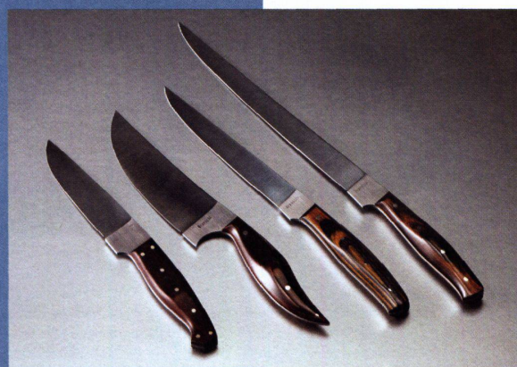
Edle Küchenmesser Couteaux de cuisine pleins de noblesse