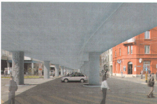
2 Variante Mitte: Aufgang der Station Messeplatz mit Messturm im Hintergrund. Eine Ideenskizze von elVisual.