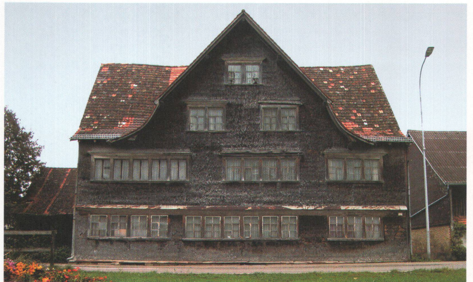
1 Trotz Schutzverfügung ist der «Löwen» in Schwarzenbach SG seit über 20 Jahren dem Verfall preisgegeben.

Ehemaliges Restaurant mit Bäckerei Löwen, 1688/89 Wilerstrasse 55, Schwarzenbach