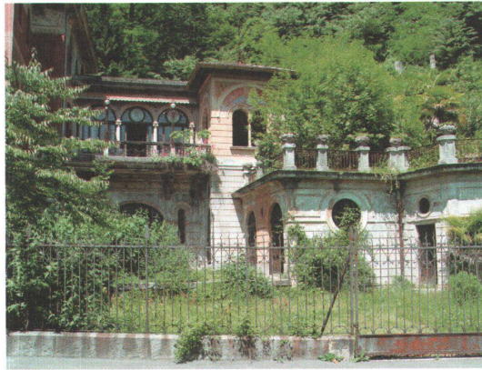
1 Seit 25 Jahren unbewohnt, inzwischen überwachsen und etwas lädiert – die Villa Branca in Melide TI.