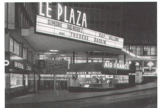
2 Der Bau aus den Fünfzigerjahren von Marc-Joseph Saugey ist fast integral erhalten. Er wurde zum Kinovorbild.