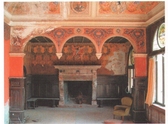
3 Das Resultat des Fantasie-Stilmixes ist so aussergewöhnlich, dass der Heimatschutz sich für die Rettung einsetzt.