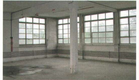
2 1933 beim Bezug wars ein Fabrikbau «neuester Konstruktion mit allen luft- und lichthygienischen Installationen».