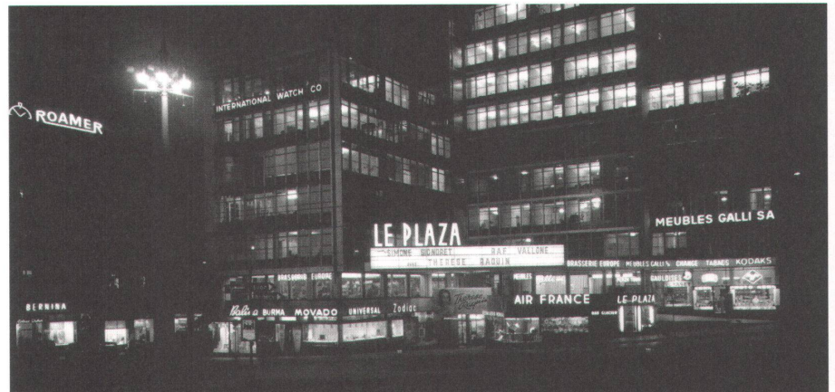
1 Das Genfer Kino «Plaza» ist Teil des Mont-Blanc-Centre. Letzteres wird renoviert. Das Kino ist deshalb seit Monaten geschlossen.

Cinéma Plaza, 1951–1953 Rue de Chantepoulet 1–3, Genf