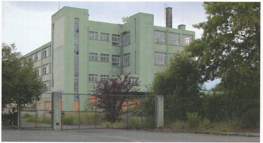
1 Lindgrün die Fabrikfassade, lindgrün die Schachteln der Schuhe von Hug in Dulliken. Jetzt sucht die Fabrik neue Nutzer.

Schuhfabrik Hug, 1932/33 Industriestrasse 52, Dulliken SO