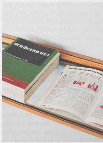
«Schön und gut»