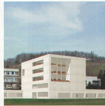
Erweiterung Kantonsschulen 97

Die Bauten der Kantonsschulen (Im Lee) und (Rychenberg) erhalten als vierte Etappe einen Neubau mit Dreifachturnhalle, Musikräumen, Mediothek, Klassenzimmer und Werkräumen. Der von einem Turm beherrschte Bau wird am Rand der Spielwiese stehen. Die Bauten von 1928, 1963 und 1990 erhalten einen zeitgenössischen Partner.