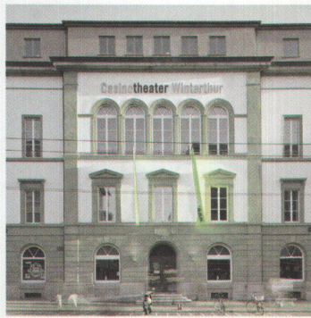
Umbau Casino-Theater 91

Einzelne Läden, kleine Firmen, Künstler und ein Brockenhaus haben sich eingenistet, ausserdem gestylte Kneipen wie das (Plan B) im Pionierpark. In einem Raum, dessen Ästhetik zwischen asiatischer Wärme und der Geselligkeit von Neu-Oerlikon pendelt, treffen sich laut Eingeweihten «die wohl schönsten Gäste der Stadt». Sie sitzen in Plan-B-Tangas (zu 16 Franken das Stück) oder Plan-B-Boxershorts (28 Franken) auf den Stühlchen und trinken Prosecco. Wer schön mitfeiern will, sollte vorab die richtige Nacht oder die richtige Nachtbegleitung wählen, denn unter der Woche fährt die letzte S12 ab Winterthur bereits um 23:52 Uhr nach Zürich. •