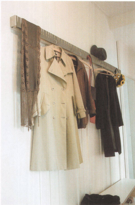
Garderobe am Laufmeter