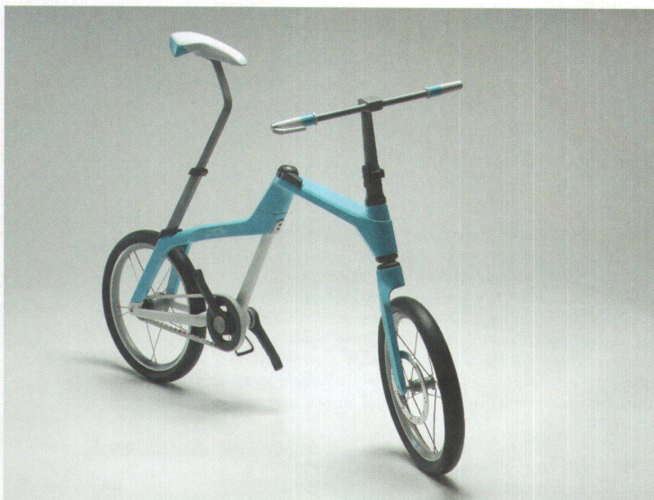
Das Faltrad: «Piega più»

Ein Reformfieber schüttelt seit Jahren in schweren Schüben die Designausbildung. Den Studierenden macht das nichts aus – sie wollen als Hochschüler der Künste das, was ihre Vorgängerinnen an der Kunstgewerbeschule wollten: ein Metier lernen.