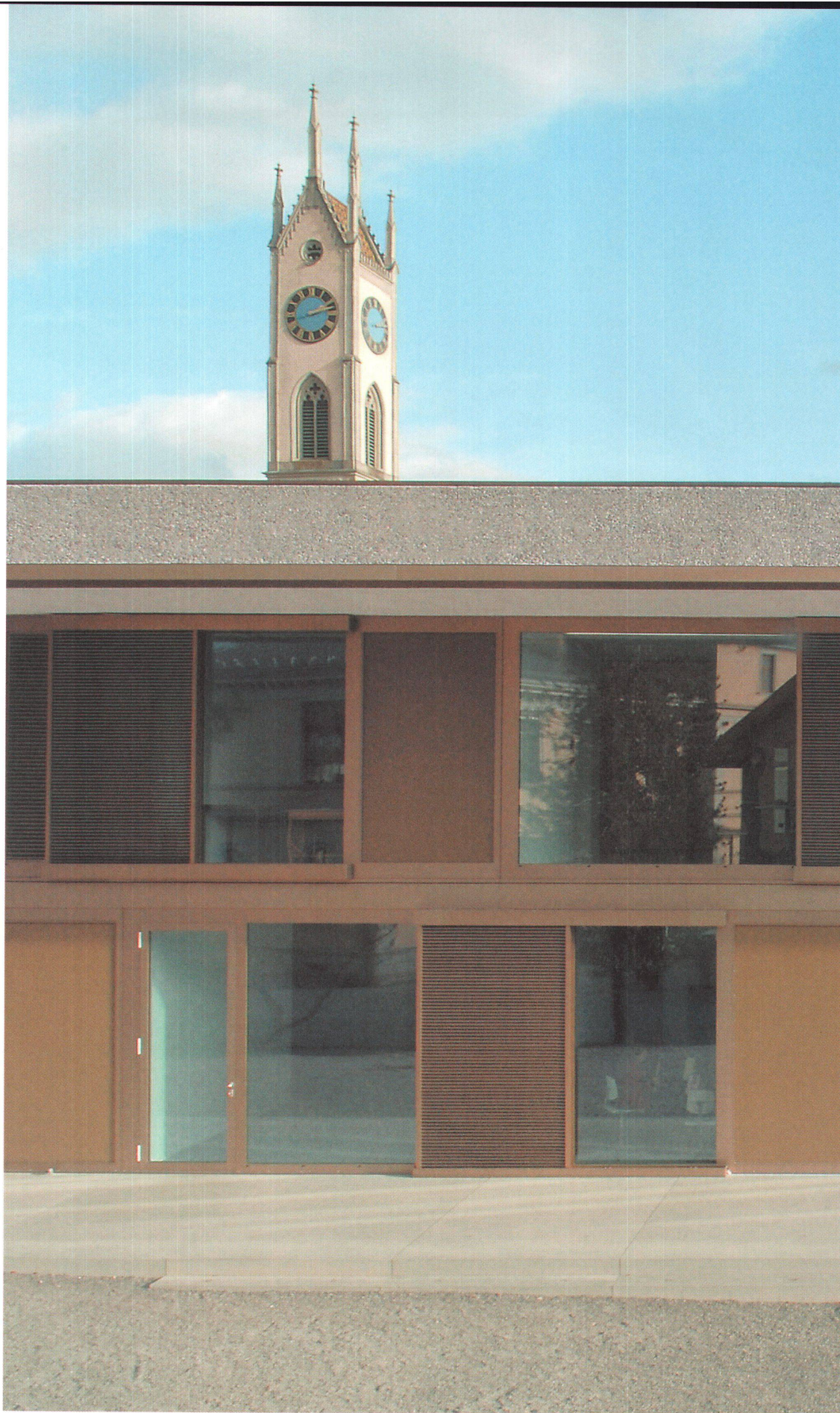
Küsnacht, Dorfstrasse: Der Neubau des Klassentraktes ergänzt ein Ensemble von Bauten aus unterschiedlichen Zeiten.