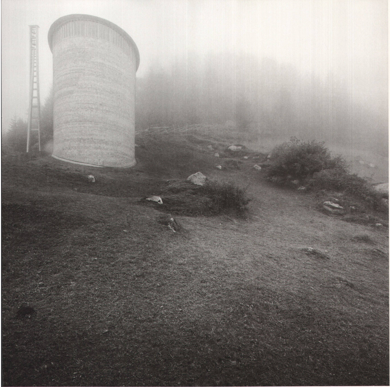
^Die «chaplutta Sogn Benedetg Sumvitg, 1989», fotografiert von Hans Danuser. Das Nebelbild aus der sechsteiligen Serie über Peter Zumthors Kapelle sorgte für Schlagzeilen in der Architektur fotografie. Zvg. Courtesy Bündner Kunstmuseum