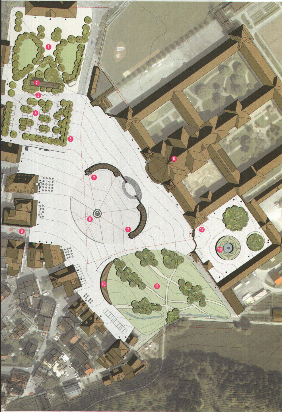
^ Masterplan mit eingezeichnetem Wettbewerbsgebiet: Das Siegerprojekt formt um den Marienbrunnen einen «Platz im Platz».