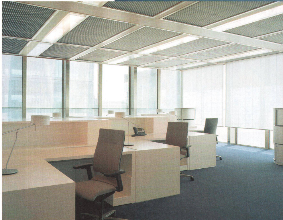
^Arbeitsinseln: In der Kunstharzplatte ist ein beweglicher Sichtschutz integriert.