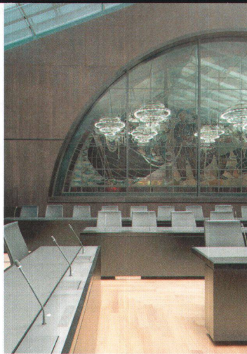
^ Der neue Saal im 3. Obergeschoss mit den Tischreihen.