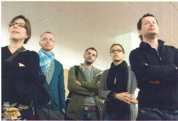
^ Aufmerksames Publikum: ausgebildete und studierende Architektinnen und Architekten während der öffentlichen Kalkbreite-Jurierung.