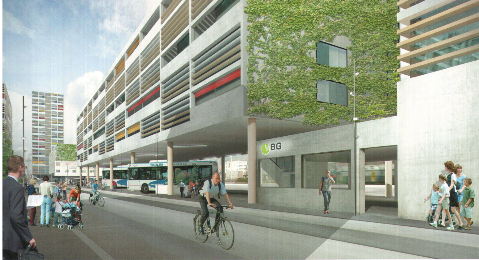
^ Bahnhofstrasse: Ein Längsbau überdeckt den Busbahnhof, dahinter ragt Max Vogts Bahnhofgebäude ins Bild. Dominant ist das 75-Meter-Hochhaus.