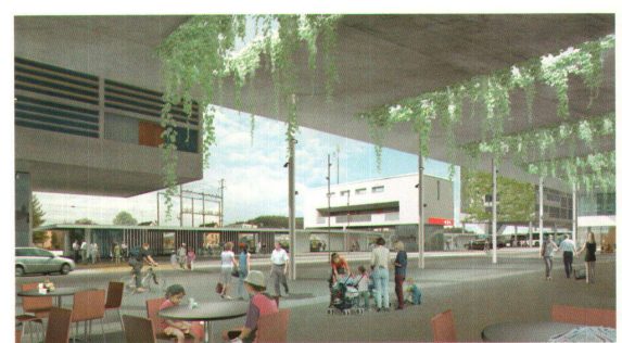
^ Bahnhofplatz: Der Platz gegenüber dem Bahnhofgebäude soll teilweise überdeckt sein – wobei das vorgeschlagene Betondach noch nicht der Weisheit letzter Schluss ist.