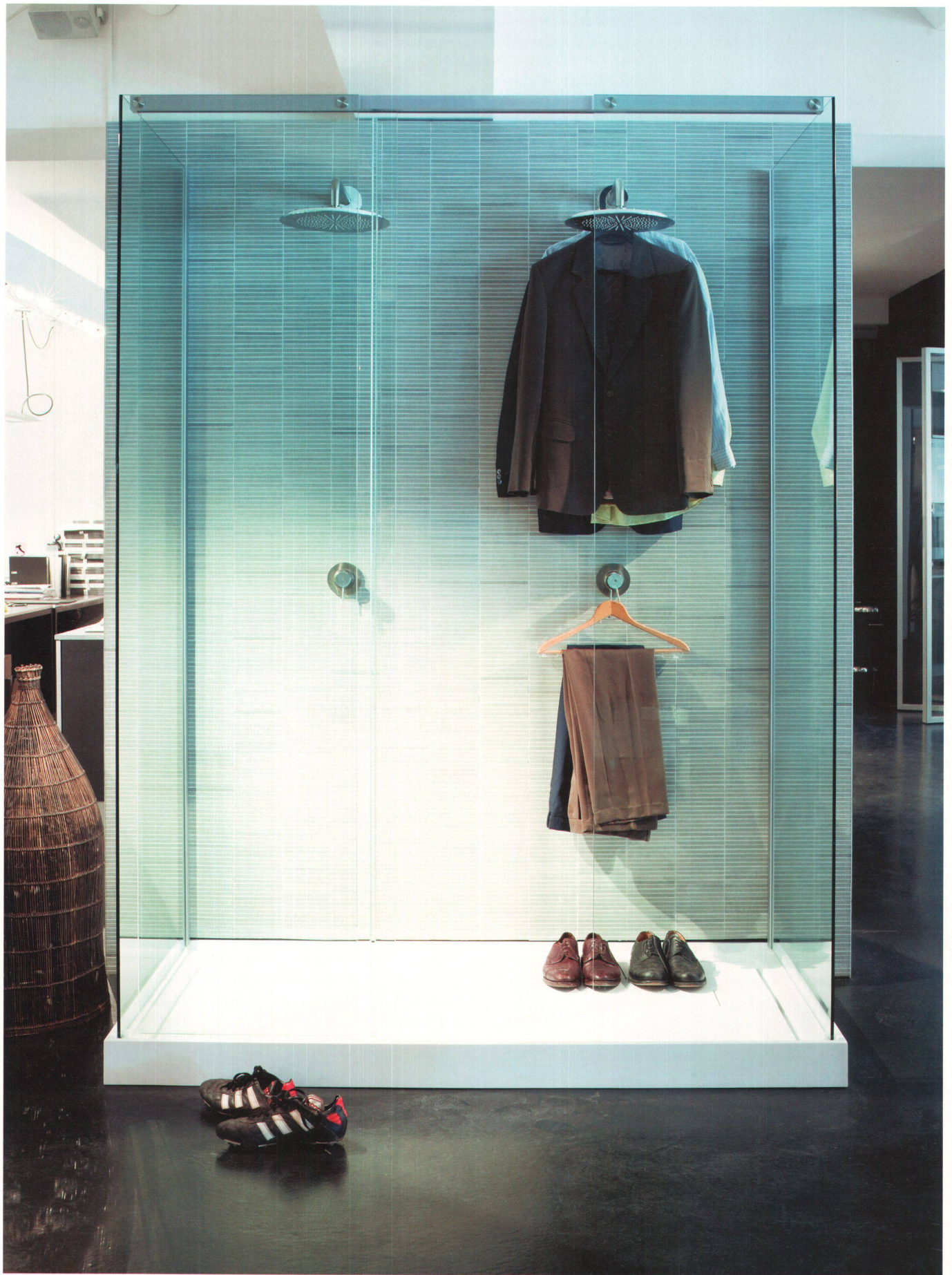
^ Im Zweierteam unter der Regendusche stehen. Oder die Dusche als Garderobe umnutzen: Wir definieren den Gebrauch selbst. Duschkopf und Wandmischer «Minimal», Duschanne «D10» von Romano Adolini.