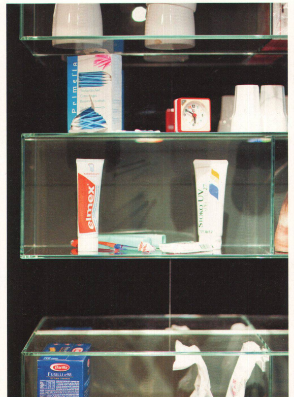
^ Längst sind die Accessoires und Aufbewahrungsmöbel im Badezimmer so perfekt wie im Wohnraum.