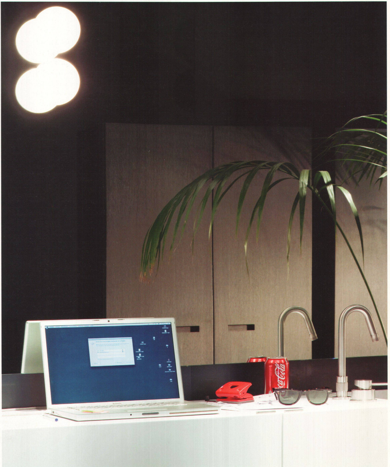
^ Arbeiten lässt sich überall. Auch im Bad. Das Laptop spiegelt sich in «Stage», liegt auf dem Waschkorpus «Zone» aus Corian, beide von Piero Lissoni, daneben die Armatur «Minimal».