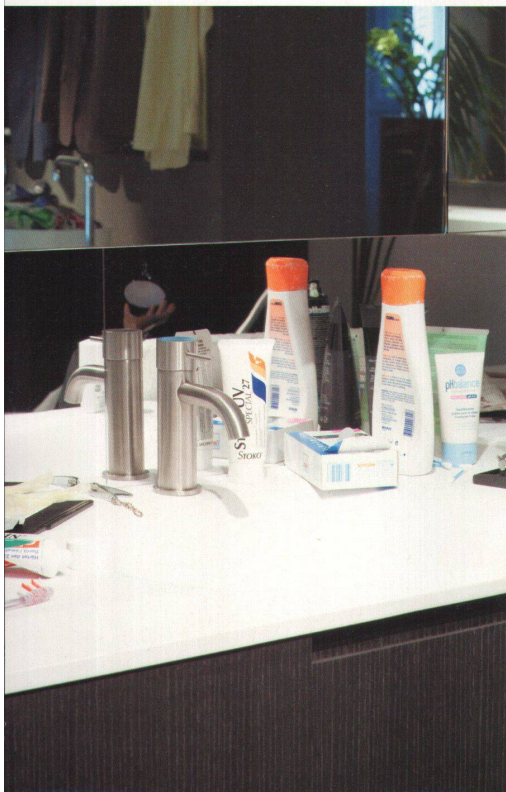
<Im Badezimmer brauchen wir vor allem Platz für allerlei Geräte und Pflegeprodukte. Ob sie was nützen, zeigt der Blick in den Spiegel: hier im Spiegel «Wedge» von Johanna Grawunder. Armaturen «Uni», GRS Boffi. Alle Bilder aufgenommen im Showroom Boffi, Zollikon. Mit bestem Dank an Boffi Studio und Redbox.

Unbestritten ist: Das Badezimmer öffnet sich, verschmilzt mit anderen Räumen – so wie das erfolgreiche Beispiel der Wohnküche zeigte. Lässt sich das Bad mit der Küche wieder vereinen? So wie wir zu Studienzeiten die gammelige WG-Küche dank Einbaudusche souverän als Badezimmer nutzten? Auch für diese Kombination besteht ein altes Vorbild: Im 19. Jahrhundert war der erste und einzige Ort, an dem kontrolliert Wasser ins Haus kam, die Küche, erst später folgte das Klosett und schliesslich das Badezimmer. Auch wenn dieses Modell auf Dauer nicht überzeugte: Küche und Bad haben planerisch gesehen viel miteinander zu tun.