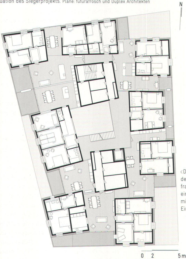
<Die Verwandtschaft mit dem Situationsplan ist frappant: typisches Geschoss eines einzelnen Hauses mit sechs Wohnungen und Einzelzimmern.