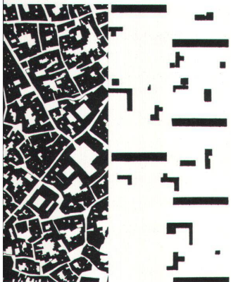
< Bernhard Hoesli, Figur-Grund-Gegenüberstellung von traditioneller dialogischer Stadt und objektfixierter Stadtvorstellung der Moderne. Aus: Werk, Bauen + Wohnen 3/83