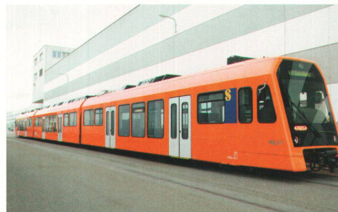
^Die durchgehende Oberkante von Fenster und Türen bindet den Zug horizontal zusammen. Das kräftige Orange macht ihn zu einem starken Element in der Landschaft.

wie Uli Huber festhält. Der ganze dreiteilige Zug ist ein einziger Raum, von den Wagenübergängen in drei Kammern geteilt. Die Fenster sind so gross, wie es die Statik erlaubte, selbst die Führerstände sind verglast. Diese Übersichtlichkeit weitet nicht nur den Raum, sie vermittelt auch das Gefühl von Sicherheit. Weil der Boden über den Drehgestellen drei Stufen ansteigt, die Decke in den Steuerwagen jedoch einheitlich durchläuft, ergibt das Raumhöhen von bis zu 2,80 Metern und viel Luft zum Atmen. Zwischen dem Erstklass- und dem Zweitklassabteil liegt ein Multifunktionsraum für Kinderwagen, Rollstühle und Velos. Die in Viererabteilen beidseits des Gangs angeordneten Sitze der zweiten Klasse und die Vier-plus-Zwei-Bestuhlung in der ersten Klasse