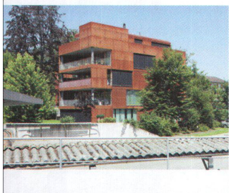
<Überraschung im Aggloбrei von Altstätten: die Wohnungen im Park von Novarona.