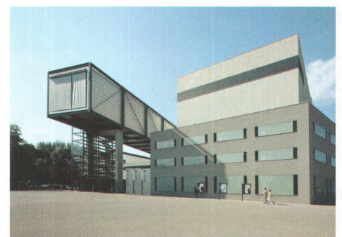
^ Mit Wolkenbügel: das Festspielhaus Bregenz von Dietrich/Untertrifaller.