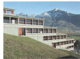
^Abgetreppт: das Schulhaus in Mairtrils von Jüngling/Hagmann.