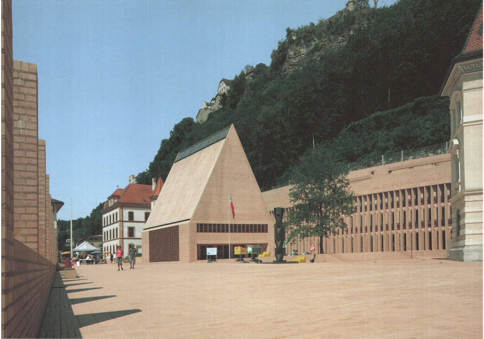
^Ziegelpredigt: das Landtagsgebäude, das Parlament des Fürstentums Liechtenstein in Vaduz, von Hansjörg Göritz.