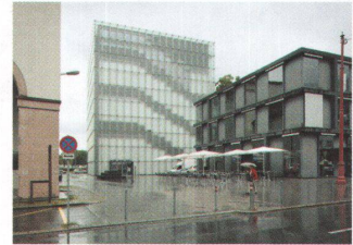
^ Wetterleuchtend: Peter Zumthors Kunsthaus in Bregenz.