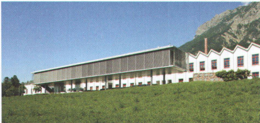
^ In der früheren Baumwollspinnerei Spoerri wird heute Architektur und Wirtschaft gelehrt.