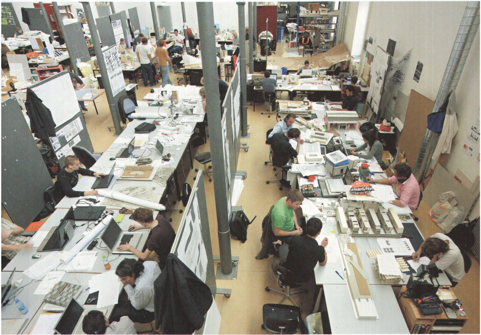
^ Angehende Architekten und Raumplanerinnen im grossen Atelier der Hochschule Liechtenstein.