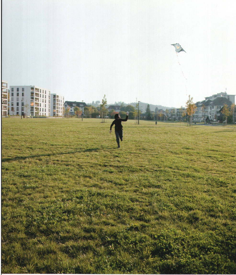
< Die grosse Wiese des Liebefeld-Parks lässt alle Möglichkeiten zur Bespielung offen.