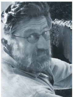
^Jürg Buchli, der Ingenieur, der immer auch mit Logik und Intuition eine Konstruktion betrachtete, bevor er nachrechnete.