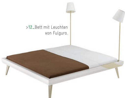
>12_Bett mit Leuchten von Fulguro.