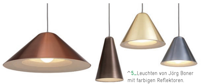
^5_Leuchten von Jörg Boner mit farbigen Reflektoren.