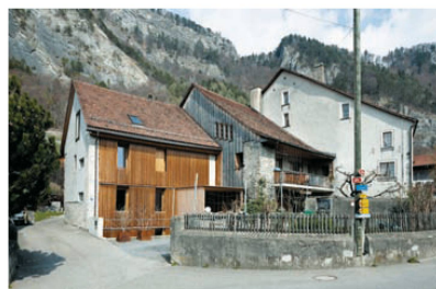
<5_Fläsch: Aus einem Stall wurde das Wohnhaus links der Familie Süssstrunk. Architektur: Kurt Hauenstein, Foto: Ralph Feiner