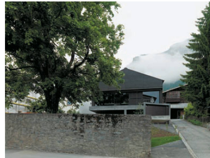
^8_Flims: Wo der Stall aus Holz war, steht das Atelier aus Beton. Architektur: Valerio Olgiati, Foto: Archive Olgiati