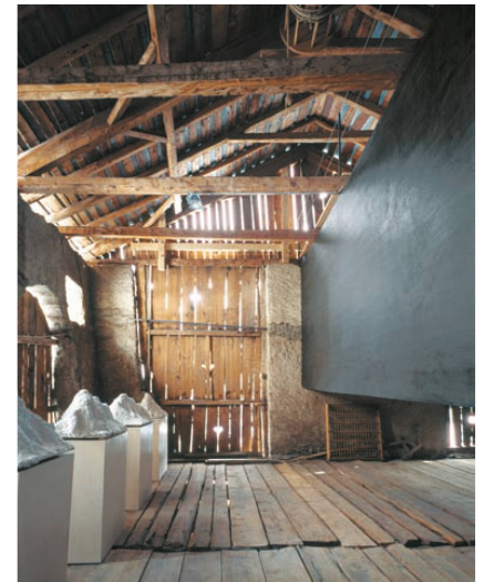
^10_Tschlin: Stall als Kunst- und Wohnhaus II. Architektur Hans-Jörg Ruch, Foto: Filippo Simonetti