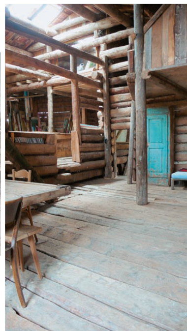
>4_Die spartanische Stallstube ist nur im Sommer bewohnbar.