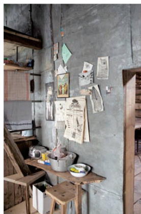
^4_Zorten: Küche und Zimmer eingebaut, Dach saniert, mehr nicht.