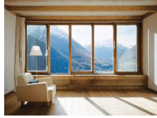
^7_Blick aus dem Stallhaus ins Unterengadin.