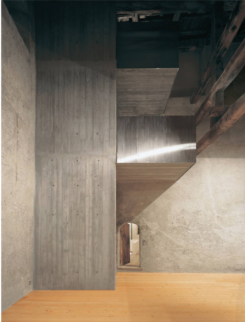
^9_Zuoz: Stall als Kunst- und Wohnhaus I. Architektur: Hans-Jörg Ruch