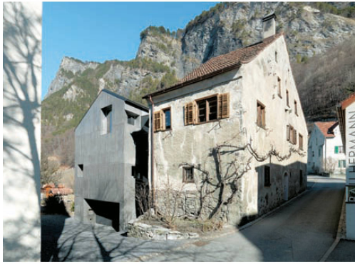
<6_Fläsch: Casascura, der Erweiterungsbau aus schwarzem Beton ersetzt den Stall. Architektur: Kurt Hauenstein