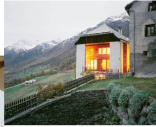
>7_Guarda: das Stallhaus am Dorfrand. Architektur: Urs Padrun, Fotos: Ralph Feiner