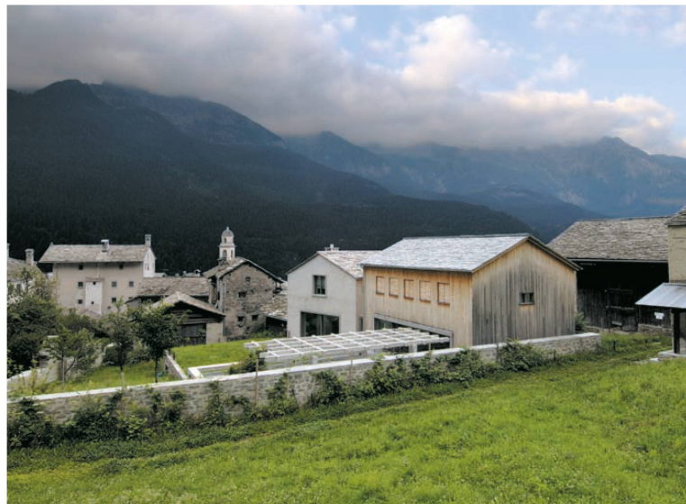
^3_Soglio: Wo der Stall war, stehen die Häuser. Architektur: Armando Ruinelli

Ähnlich reagierte Architekt Olgiati auch bei seinem eigenen Bürohaus in Flims. Er brach einen Holzstall ab und stellte an seine Stelle ein Gebäude aus radikaler Architektur. Von aussen scheint sich das dunkle Bürohaus anzuschmiegen an seine Umgebung aus dunkel gebrannten Ställen, innen ist es eine virtuose Betonkonstruktion für eine Raumfuge, die mit dem Stallgedächtnis nichts mehr zu tun hat. >>