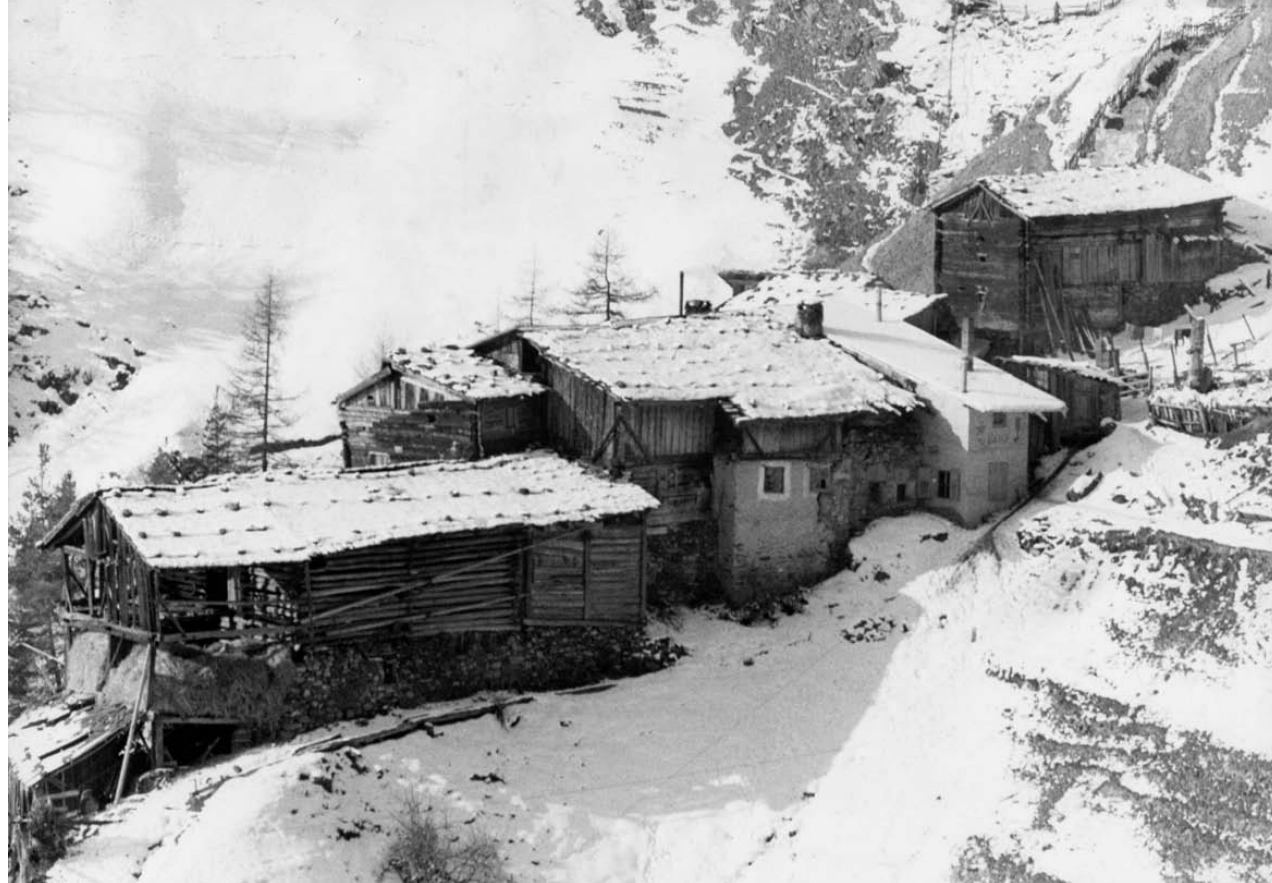
^ Bergbauernhof Vorra an einer Extremlage in St. Martin im Kofel, einer Fraktion der Gemeinde Latsch.