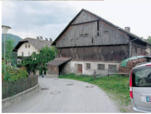
^14_Der alte Stadel gab die Proportionen vor.