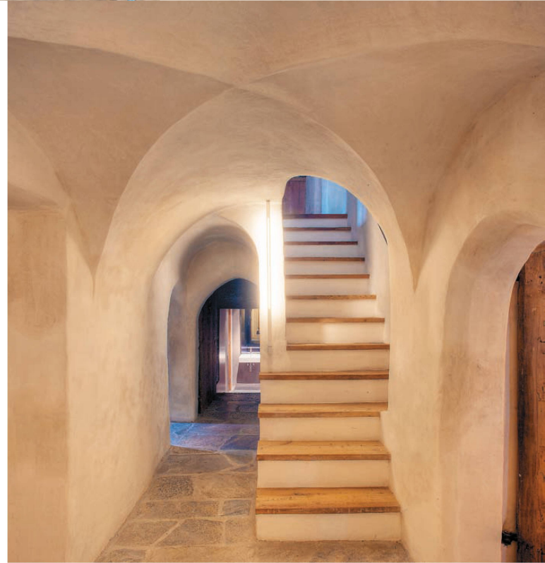
^13_Das 1490/1500 errichtete Widum lebt als Ferienresidenz weiter.