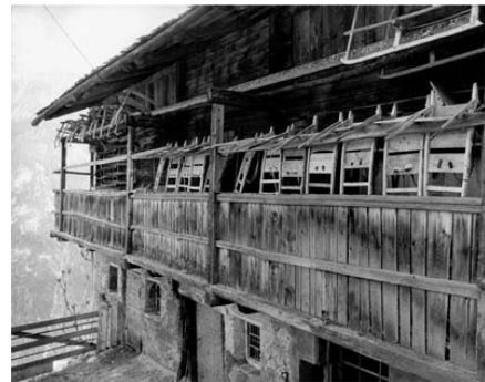
> Traggestelle für schwere Lasten auf unzugänglichen Wegen.