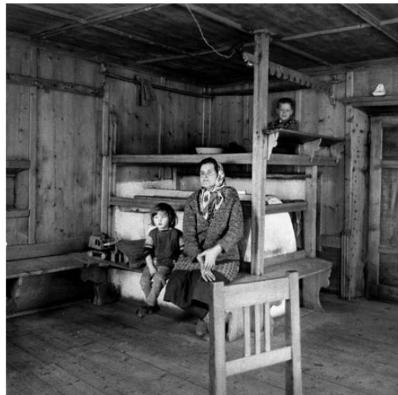
^ Karge Gemütlichkeit in der warmen Stube.