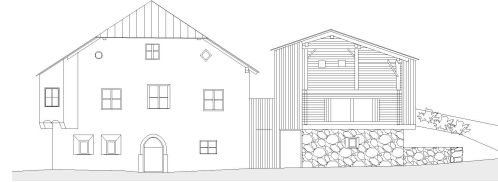
✓13_Das Widum und sein Stall.