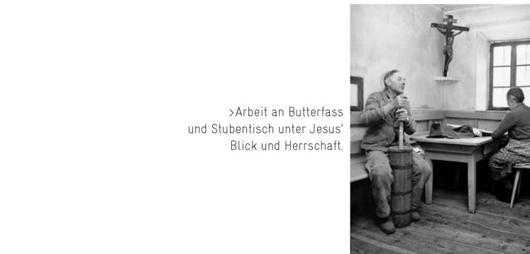
> Arbeit an Butterfass und Stubentisch unter Jesus' Blick und Herrschaft.