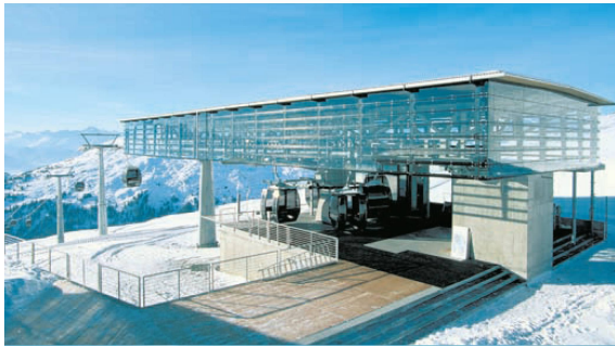
< Gestaltete Hülle: die Bergstation der Gondelbahn Nagens bei Flims von Marcus Gross und Werner Rüegg von 1997.