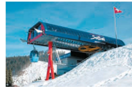
< Ein Modul für überall: Die Bergstation der Gondelbahn Hochstuckli in Sattel SZ.