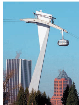
^ Die Verbindung zur Stadt: Luftseilbahn der Universitätsklinik in Portland, Ohio, vom Zürcher Büro agps. Selbst die Stützen sind entworfen.