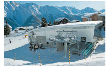
∨ Versteckt im Hangar: die Sesselbahn Hohfluh auf der Riederalp VS.