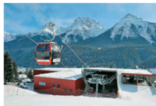
< Das Truckli im Tal: Die Talstation der Gondelbahn Motta Naluns in Scuol GR.