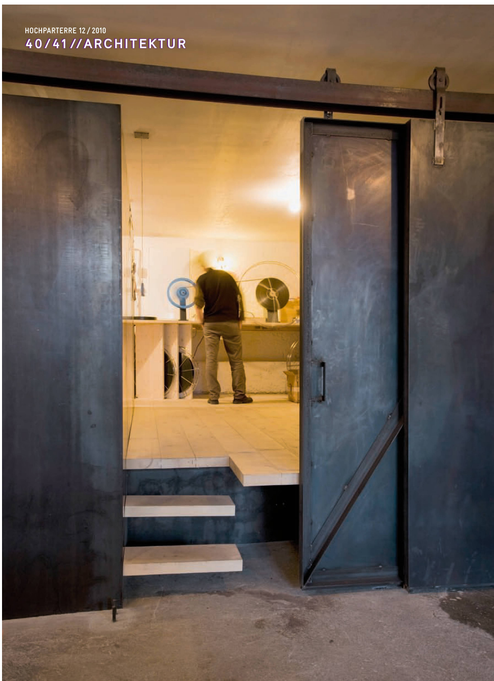
^Der Raum des Filmvorführers liegt hinter einer grossen Stahlschiebetür.

CAPPAUL & BLUMENTHAL ARCHITECTS Gordian Blumenthal (43) und Ramun Capaul (41) studierten an der ETH Zürich Architektur, Ramun Capaul auch Kunst in London und lehrte an der Rhode Island School of Design (USA). Gordian Blumenthal arbeitete im Atelier Peter Zumthor. 2000 gründeten beide das Büro Capaul & Blumenthal Architects. In Zusammenarbeit mit der Denkmalpflege des Kantons Graubünden, dem Bündner und Schweizer Heimatschutz erforschen sie die Siedlungsstruktur, die Haus-, Material- und Konstruktionstypologie ihrer Heimat. Sie planten und realisierten sorgfältig gestaltete Umbauten wie die Casa da Meer in Lumbrein und die Casa Alva in Vignogn. Zurzeit restaurieren sie das Türalihus in Valendas für die Stiftung Ferien im Baudenkmal. 2008 erhielten sie den Eidgenössischen Kunstpreis.