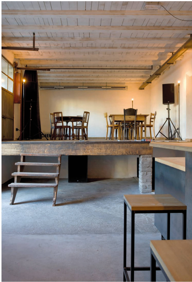
>Im Foyerraum spielt die vorhandene Bausubstanz die Hauptrolle.

<Seite 36 Der Blick in eine Traumwelt aus Lehm und Licht.