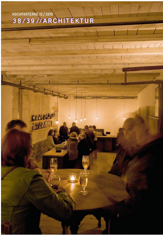
^Das Foyer dient als Bar, Konzert- und Theaterraum.