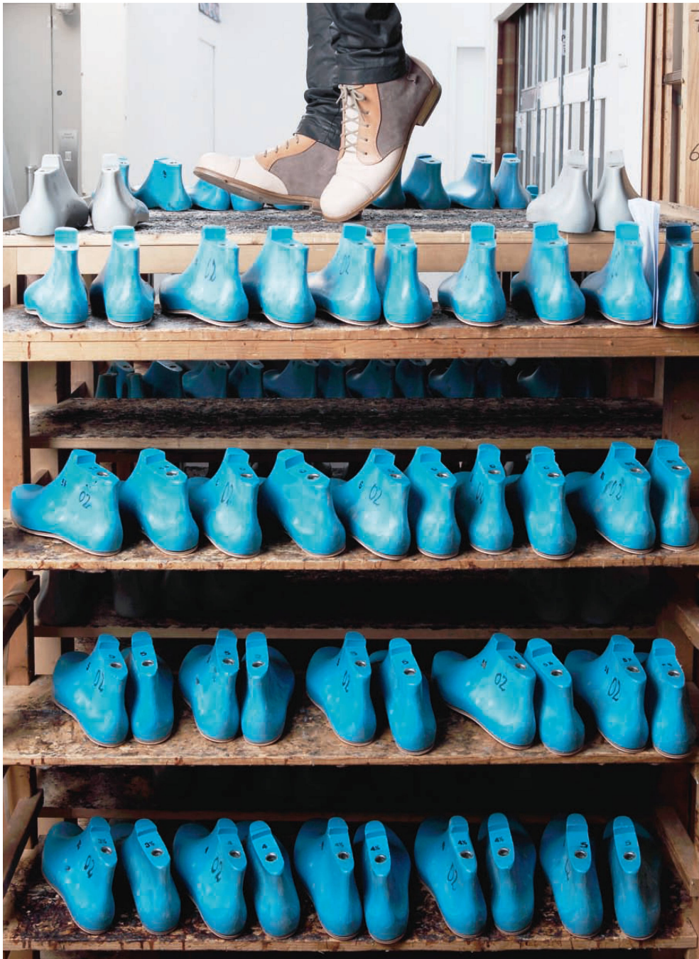
^Hohe handwerkliche Sorgfalt durchzieht die gesamte Produktion der Herrenschuhe. Auch nach langem Tragen sollen sie ihre Form behalten.

«Seite 52 Anita Mosers Schuhe wirken nostalgisch: Die Designerin arbeitet mit einer klassischen Linienführung und kombiniert unterschiedliche Lederqualitäten in verschiedenen Farben.